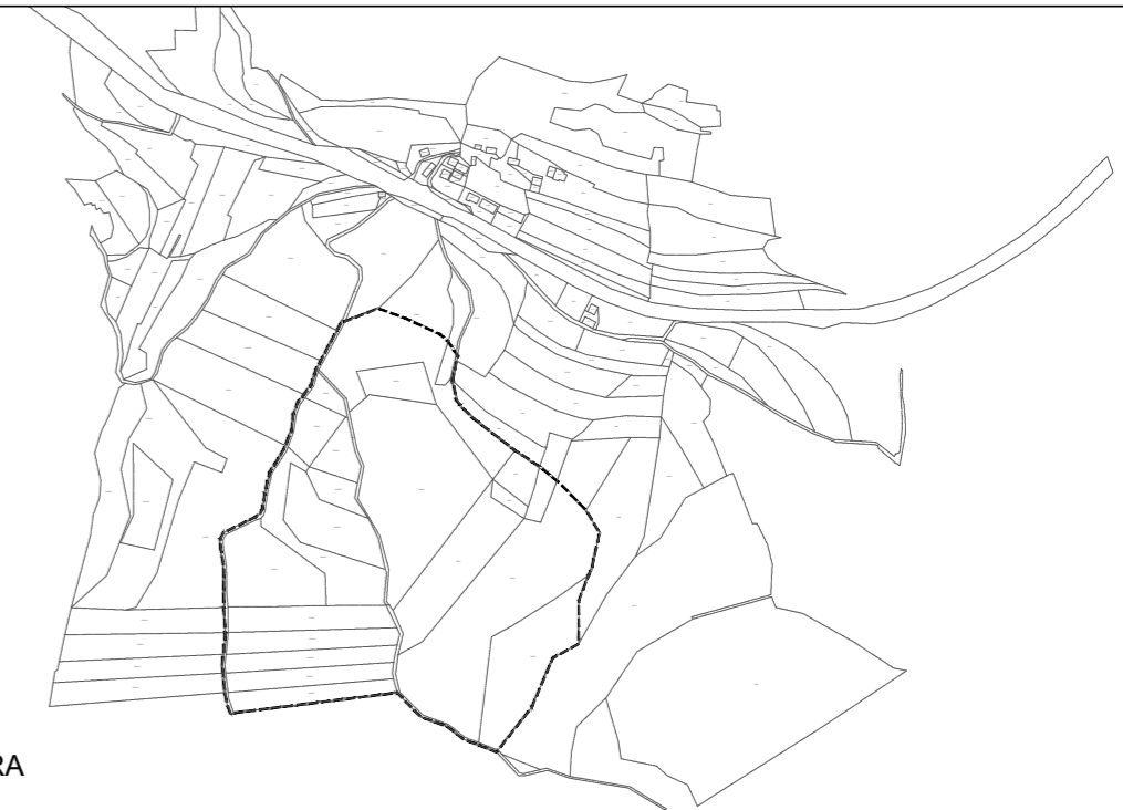
IZSEK IZ KATASTRA M 1:10000