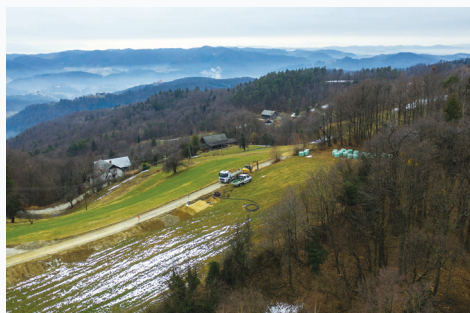
Izgradnja vodovodne trase na območju Zabukovja.

Podpora Evropske unije in državnega proračuna za realizacijo projekta je 2.353.881,65 evrov. Kohezijski sklad za realizacijo projekta prispeva 2.204.575,97 evrov, Ministrstvo za gospodarski razvoj in tehnologijo pa 389.042,82 evrov. Občina Sevnica za projekt prispeva 902.628,30 evrov. Izvajalec gradbenih del podjetja je podjetje Komunala Sevnica. Vrednost pogodbenih del je 3.110.616,38 evrov.