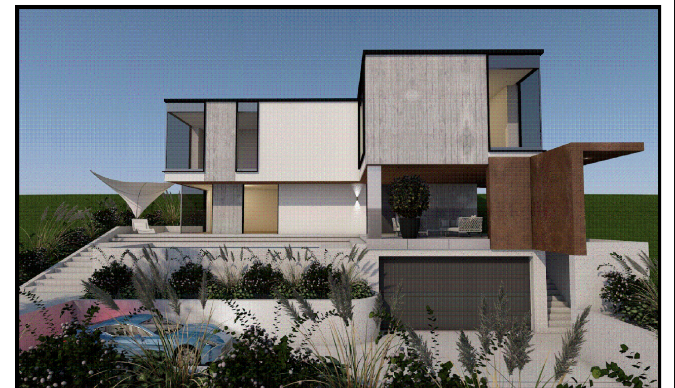
VIZUALIZACIJA STANOVANJSKEGA OBJEKTA