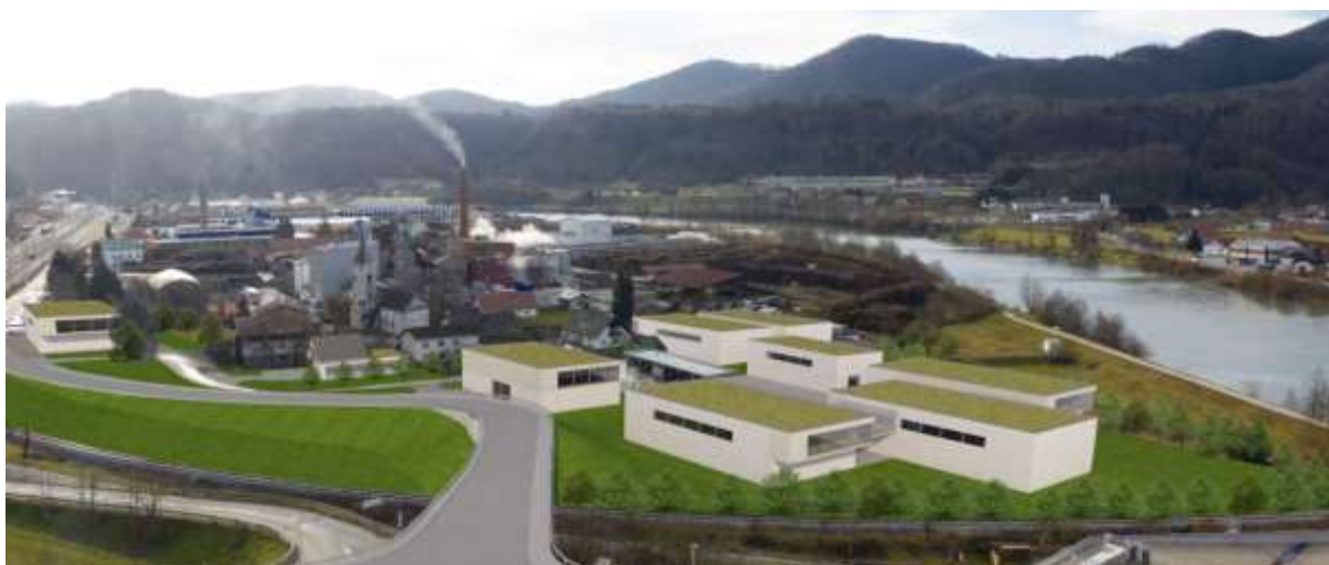
Slika 1: Varianta 2B kot izhodišče za pripravo SD ZN 9