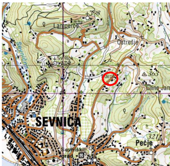
Slika 2: širši prikaz v prostoru – topografija