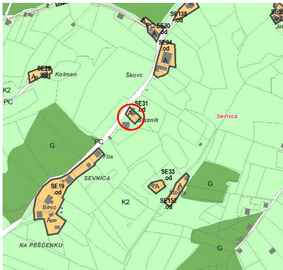
Slika 1: Izrez iz občinskega prostorskega načrta

Na območju navedenega izvornega območja še ni bilo izvedene lokacijske preveritve.