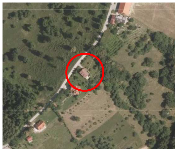
Slika 3: širši prikaz v prostoru – digitalni ortofoto posnetek