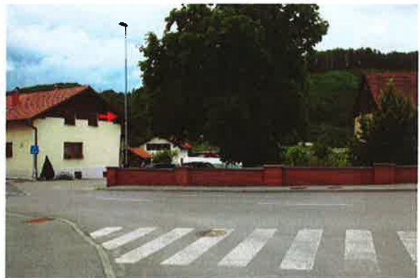
Sevnica, K04: Kvedrova cesta-Florjanska ulica