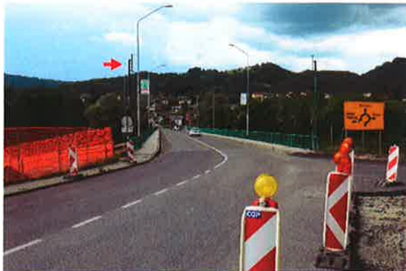
Sevnica, K06: Hermanova cesta-most čez Savo