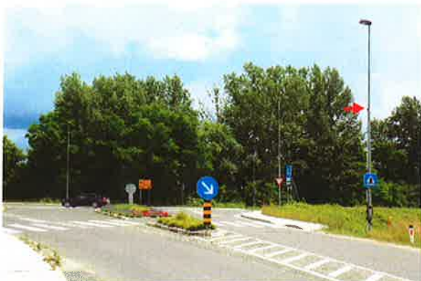
Boštanj, K05: R1-215-G1-5 (pri Hoferju)

- med 12.00 in 14.00: predstavitev 4 kamer za 24-urno anonimno štetje prometa na naslednja štiri merilna mesta