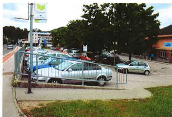
Sevnica, parkirišče za ŽP Sevnica