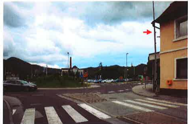
Sevnica, K02: Šmarska cesta-Planinska cesta