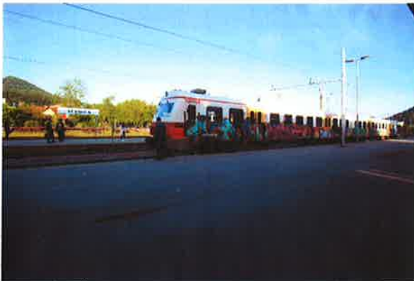
Sevnica, ŽP Sevnica, prihod vlaka

- med 6.30 in 8.00: ogled avtobusne in železniških postaj, vozni redov ter informativno štetje potnikov