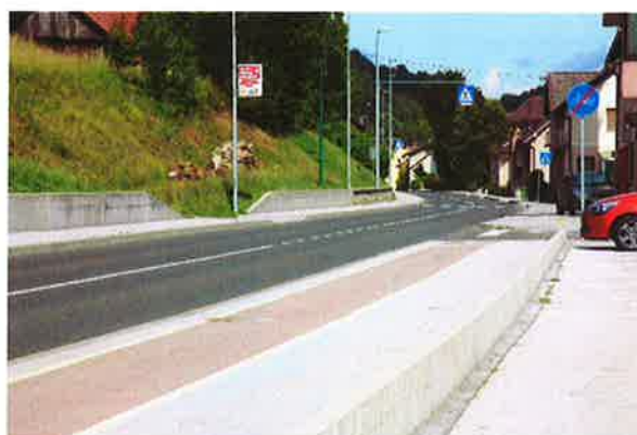
Sevnica, konec kolesarske poti pri PGD Sevnica