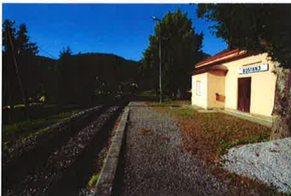
Boštanj, ŽP Boštanj