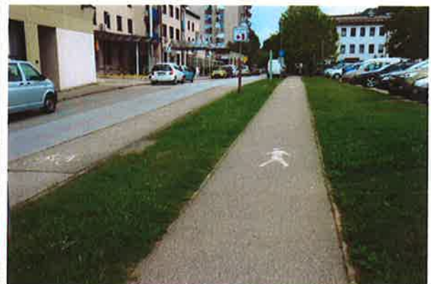
Sevnica, dobra ureditev kolesarske poti ob parkirišču za ZD Sevnica, ki pa je hitro zmanjka

(mimogrede ob 10. uri oz. malo prej in kasneje, ko naj bi od ŽP Sevnica brezplačni minibus po voznem redu začel svojo pot, ugotovimo, kar kaže naslednja fotografija)