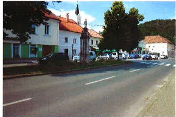
Sevnica, ureditev Glavnega trga

- po 16.00: obhod javnih parkirišč in ugotavljanje njihove zasedenosti v popoldanski konici