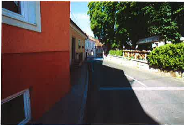
Sevnica, ureditev v starem mestnem središču

- med 10.00 in 12.00: nadaljevanje ugotavljanja urejenosti površin za kolesarje in pešce