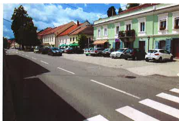
Sevnica, parkirišče na Glavnem trgu

- med 15.10 in 16.00: ugotavljanje urejenosti površin za kolesarje in pešce