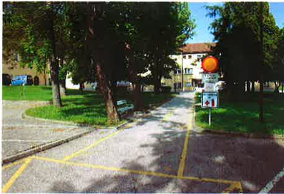
Sevnica, ureditev površin pri občinskih uradih