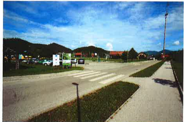
Boštanj, ureditev pri osnovni šoli