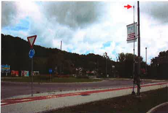
Dolenji Boštanj, K01: G1-5-most čez Savo (pri Tušu)

- do 12.00: postavitve 4 kamer za 24-urno anonimno štetje prometa na prva štiri merilna mesta