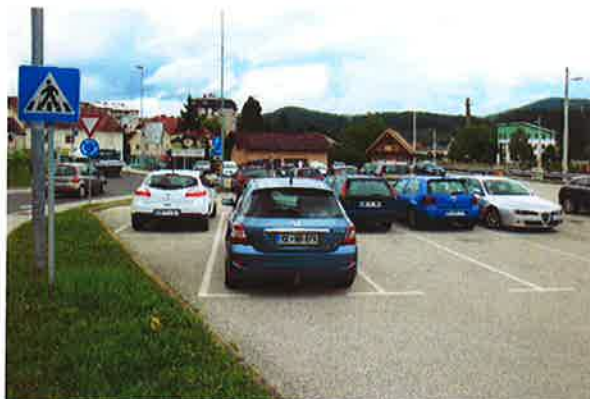
Sevnica, parkirišče ob krož. Šmarska-Planinska

- med 12.00 in 15.10: evidentiranje javnih parkirišč, ugotavljanje njihovih kapacitet, zasedenosti v opoldanski konici in drugih lastnosti (na slikah je nekaj primerov)