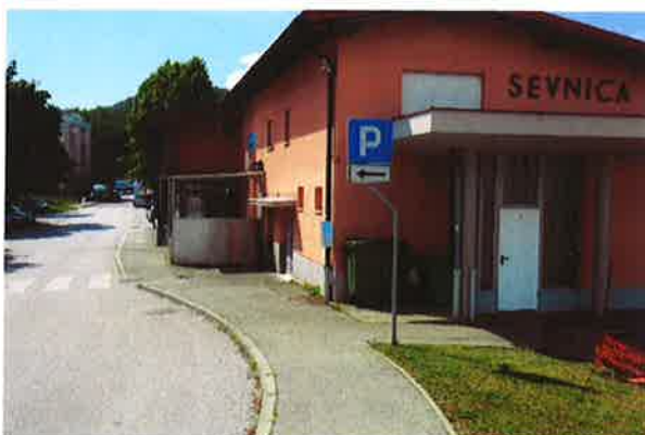
Sevnica, začetna postaja minibus pri ŽP Sevnica ob 10. uri

(mimogrede ob 10. uri oz. malo prej in kasneje, ko naj bi od ŽP Sevnica brezplačni minibus po voznem redu začel svojo pot, ugotovimo, kar kaže naslednja fotografija)