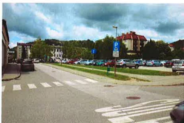
Sevnica, parkirišče za ZD Sevnica