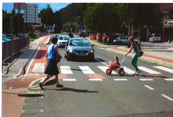
Sevnica, ureditev na Trgu Svobode

- med 15.10 in 16.00: ugotavljanje urejenosti površin za kolesarje in pešce