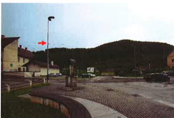
Sevnica, K08: Kvedrova cesta-Drožanjska cesta

- okrog. 15.00: okvirno štetje potnikov na ŽP Sevnica in na avtobusni postaji, kjer spet ni bilo nikogar