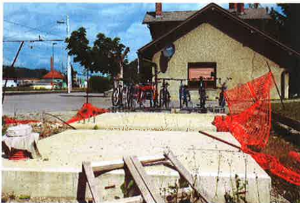
Sevnica, ŽP Sevnica, stojala za kolesa