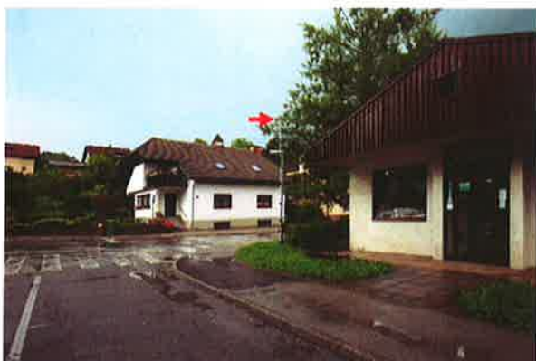
Sevnica, K07: Nas. heroja Maroka-Trg svobode