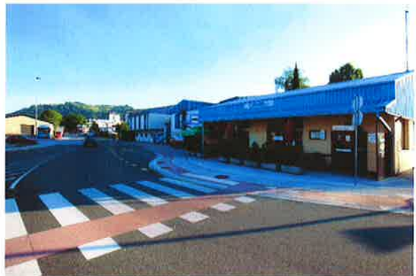
Sevnica, AP Sevnica