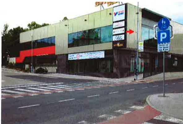
Sevnica, K03: Trg svobode-Prešernova ulica